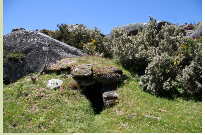
Chivana de pastores