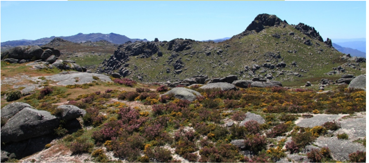
Coto da Fontefría