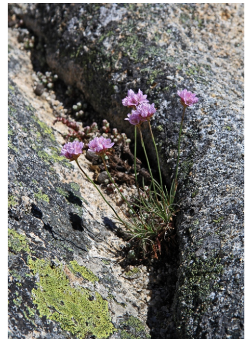
Armeria humilis , só se atopar nas partes altas do Xurés.

Tamén se pode facer travesía cruzando ata Pitoes des Junias, na outra banda da serra, en Portugal, ou seguido ata a Portela.