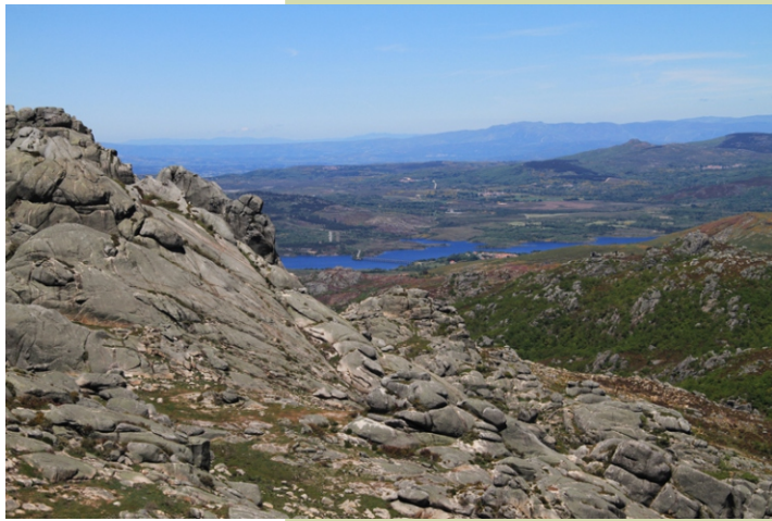
Vista sobre o encoro de Salas