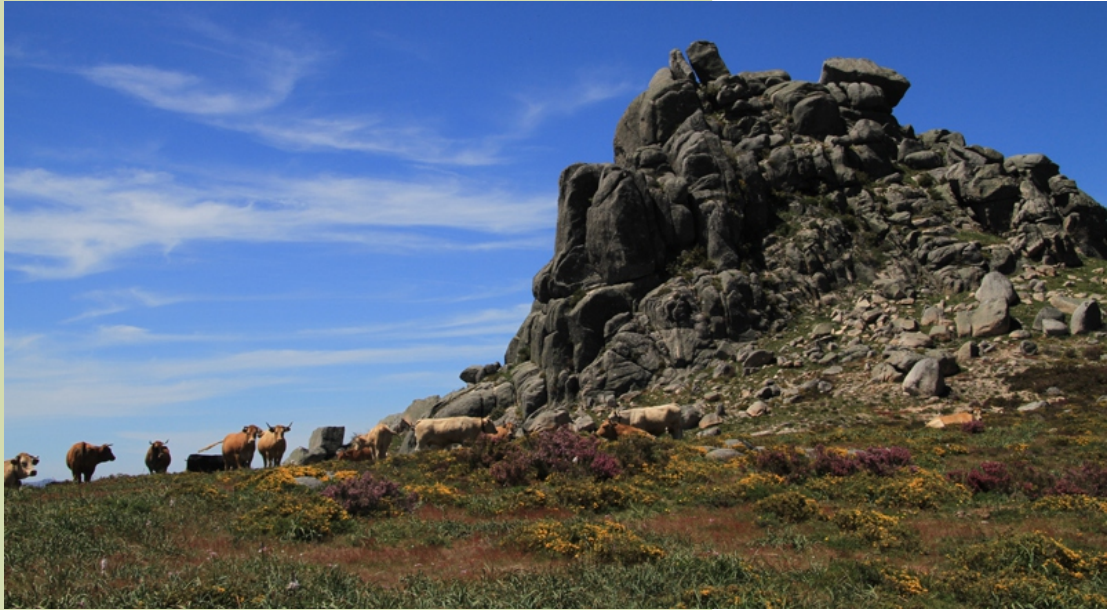
Coto das Gralleiras