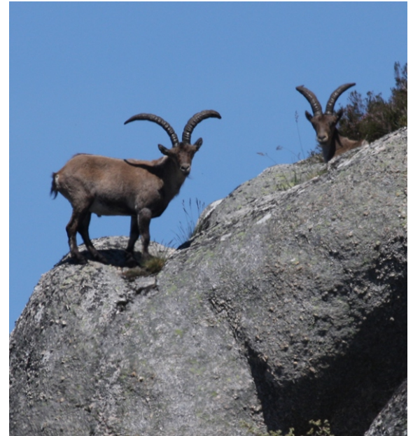
Cabras feras nos penedos das Gralleiras.

Unha ruta para coñecer unha das áreas máis emblemáticas da serra do Xurés.