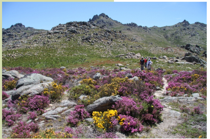
Camiño dos cumes