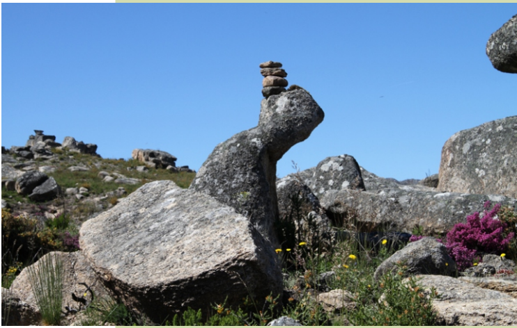
Un curioso fito na ruta.