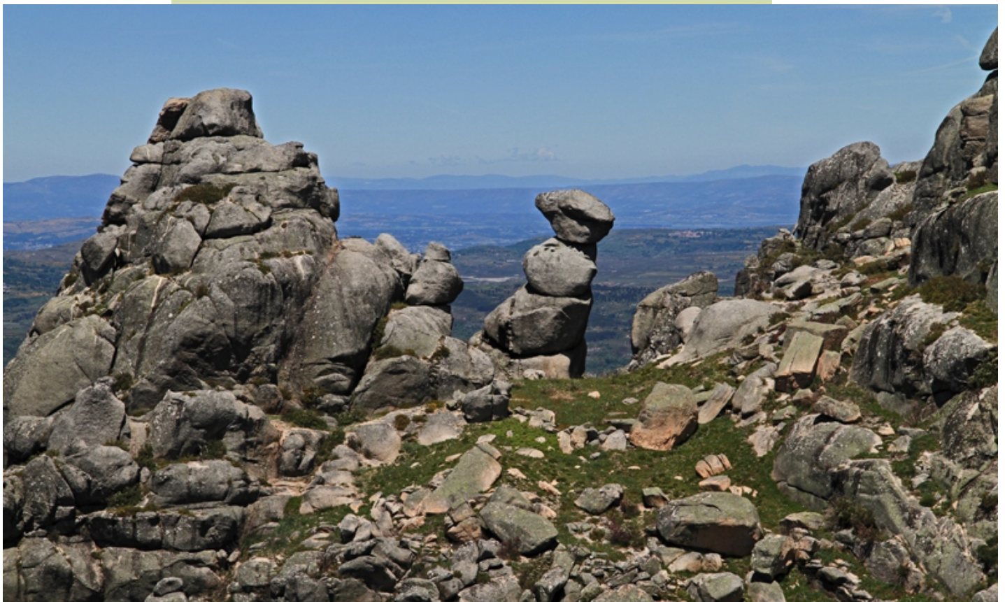
"A Pica", nun dos cumes das Galleiras.