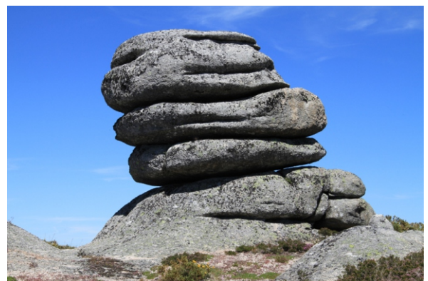
Unha das numerosas formacións rochosas das Gralleiras.