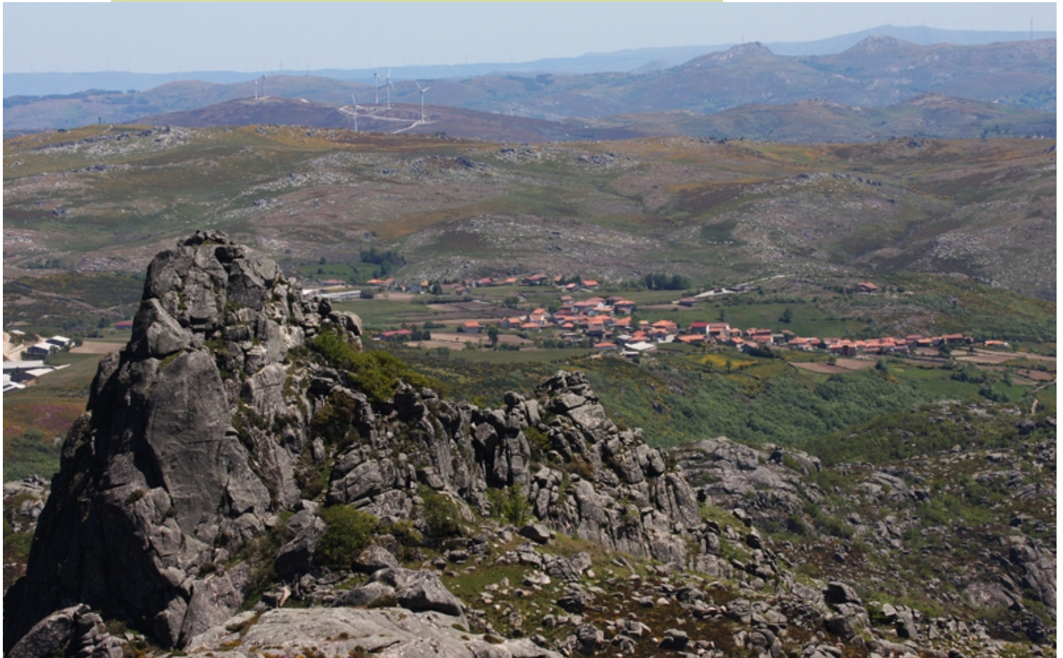
Vista de Piteos das Junias desde o alto das Gralleiras